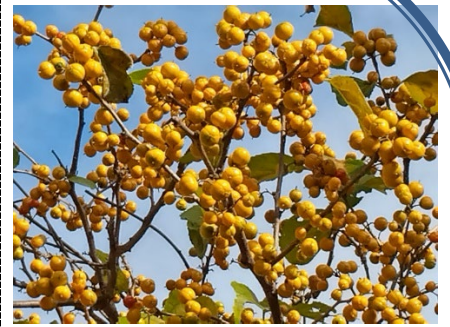
ツルウメドキ(12月2日撮影:N.K)

この時期花は少なくなります。いろいろな実(果実)を楽しむのはいかがでしょうか。道路に面したフェンス際にはナンテン(実の色:赤)・アメリカムラサキシキブ(紫)・サネカズラ(赤、別名は美男葛)・ツルウメドキ(橙赤)などが見られ、花壇内にはセンリョウ・マンリョウ・ヤブラン・その他(探してみてください)が見られます。