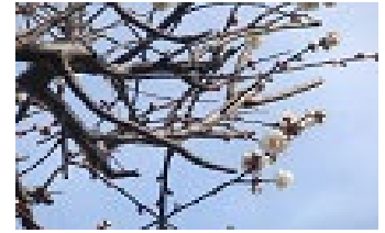
花壇入り口で咲いています!