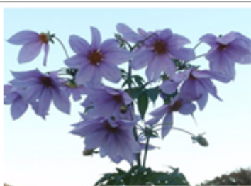
里親花壇の親株(2021秋撮影)

今年は3月～4月にかけてどのぐらいの割合で根付くかはっきりしませんが、大事に育てて今年の秋には芽吹き大輪の花を咲かせ、地域の美化に貢献してくれるものと期待しています。