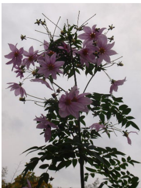
B地区の生き残り株満開: