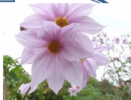
斜面地皇帝ダリアの親株です (昨年11月末撮影)

皇帝ダリア(木立ダリア・タラノハダリア・ツリーダリア)が中旬頃から咲き出します。花言葉は「乙女の真心」だそうです(花言葉って誰が決めたのでしょうか?)。晩秋から初冬、花の切れた時期に大きな花を咲かせ、派手で、目を引きまします。一時ブームとなり、あちこちで見られましたが、最近は少ないように思えます。集団で植えられていると大変目立つので、花壇でもよく写真を撮りに来る方を見かけます。はじめ花壇の中央で栽培していたのですが、背が高いため台風にも弱く、また少し扱いにくいところがあり、水道局敷地のフェンス横と南町に面した大斜面に移し替えました。